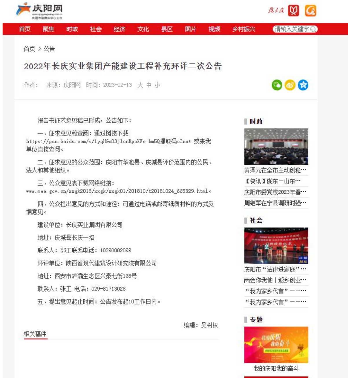
图 3-4 网站征求意见公示截图

在张贴公告和报纸公示的同时，我单位在庆阳网网站（ http://www.qingyangwang.com.cn/content/2023-02/13/content_621143.htm ）的新闻中心“文件公示”公示了环评报告全文，见图 3-4。在报纸公示和张贴公示中均有该全文公示的网址链接。